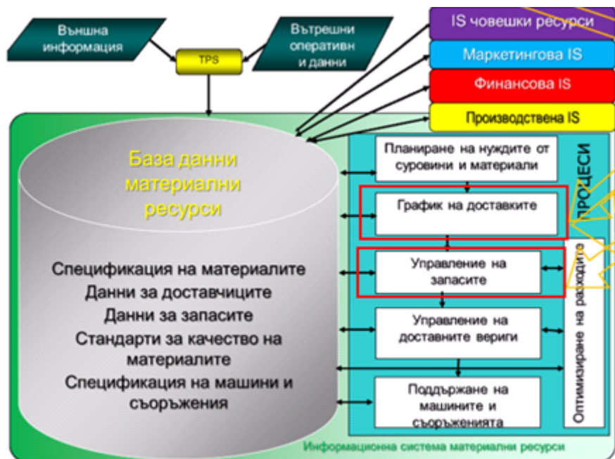
Фиг. 1 Примерна функционалност

( http://fbm.uni-ruse.bg/d/itu/ITU-L-7-text.pdf )