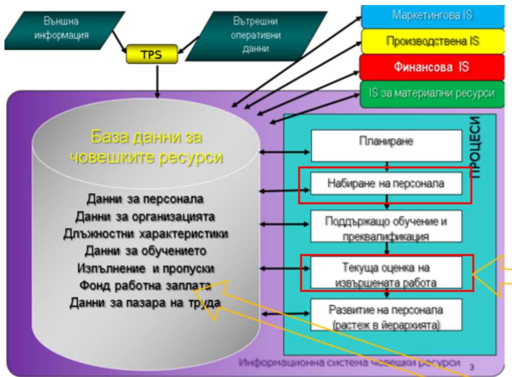
Фиг. 1 Примерна функционалност

( http://fbm.uni-ruse.bg/d/itu/ITU-L-6-text.pdf )